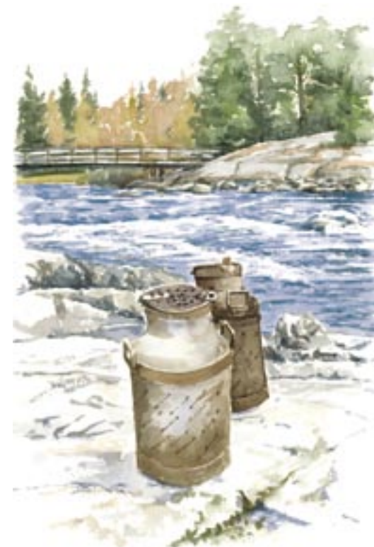
Nettingtinor vid Nettingforsen nära Rickleåns mynning