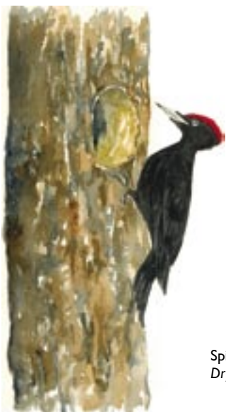
Spillkråka Dryocopus martius

Skogen på Klubben har en genuin karaktär av naturskog. Vid havet finns blottlagd mark och strandängar som ersätts av albuskar och längre upp av granskog. Landhöjningsskogen kan liknas vid urskog. Arter som trivs i naturskogar är hackspettar t.ex. spillkråka samt olika arter av lavar och vednedbrytande svampar.